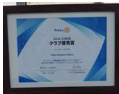
RI より贈呈されたクラブ優秀賞